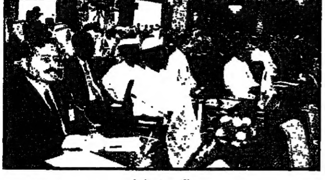
جانب من الوفود

وزراء الأوقاف والشئون الإسلامية أكدوا: الكلمة تعبير عن برهة جديدة وصياغة جديدة للركبة الإسلامية • وبغية هامة من وثائق المؤتمر وفتح جديد للعالم الإسلامي • الكلمة تمثل روح التسامح.. وتعبر عن الموضوعية الإسلامية • كلمة حكيمة وبلغة ومعبرة عن قضايا الأمة الإسلامية